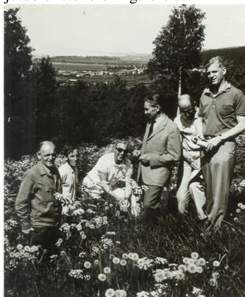
På exkursion i Södra Vätterbranterna.