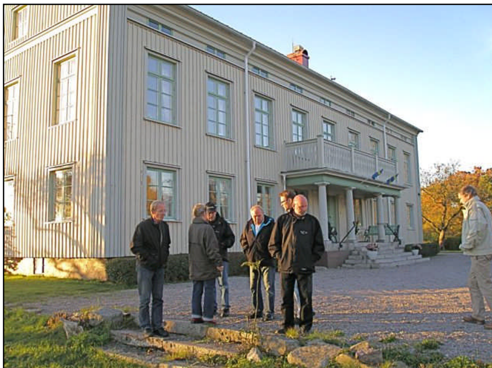
8. Delar av Smålands Naturs styrelse framför huvudbyggnaden i Osaby.